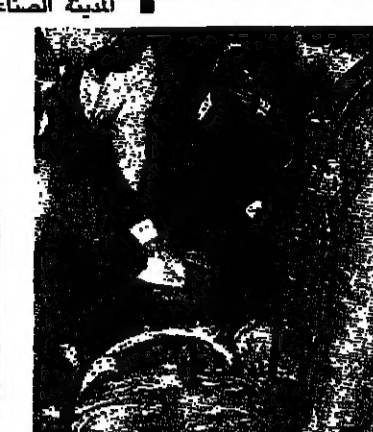
عبد القدر السعدي قبل وفاته

المؤمنين حنا الحلو اثناء شوقه انفسكم. من جهة اكد التنظير الشعبي الناصري في تصريح له على عدم رج اي منطقة. وخاصة بلدة مغدوشة ان مناطق سينيخ والمدينة الصناعية ويولفار معروف سعد وخلافا لما نشر وروج له في بعض وسائل الاعلام قد تعرضت منذ فجر اليوم الى قصف مدفعي مركز وريصاص قنص. من امراض مدفعية مشوشة لنا ومحددة من قنص دروب السيم ومغدوشة. حيث اصيب عدد من المواطنين الصيداويين وادى الى شلل حركة السير. واقتل المحلات التجارية في المدينة الصناعية. وقال البيان من هذا المنطلق نشر ان اننا لم تكن المبادئ في اي قصف على مغدوشة. بل اننا لود الاعتداءات من اي صدر كان في المدينة واعلمنا ولن نسمح بان يكون المواطنون الصيداويين عرضة لعنفهم وحياتهم للخطر من قبل الميليشيات. وقال البيان اننا ندعو اهالي مغدوشة التي كان لنا معها تاريخ من العيش المشترك الاخوي طوال سنوات الحرب الى عدم الانجرار وراء مسلسل القذائف التي يعمل من اجله لثقتنا المنطقة وايضا فرز سكاني. كما نضرم الى خطورة الاطلاق في منطقتنا توسيع رقعة الاستيلاءات. وجرهم (البلقية على الصفحة 10)